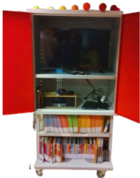
Une armoire audiovisuelle avec lecteur DVD, poste CD radio, écran, casque Bluetooth

pour écouter des histoires, regarder des documentaires, utiliser des outils audiovisuelles