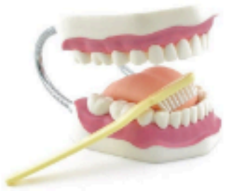
Une bouche avec la mâchoire, langue et dent