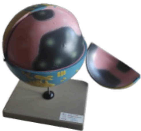
Le modèle terrestre