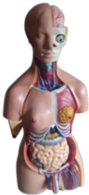
Un buste sexué